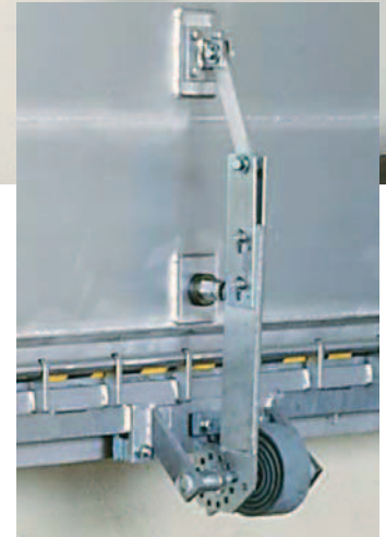
Sprężynowy mechanizm podnoszenia