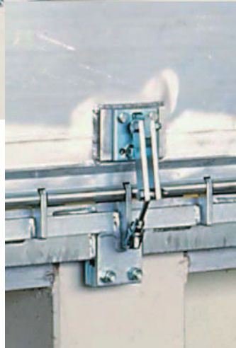
Zabezpieczenie przed opadnięciem